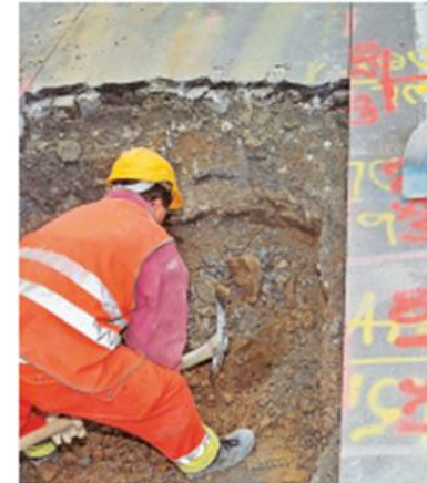
1 Werkleitungen bei Bedarf sondieren.