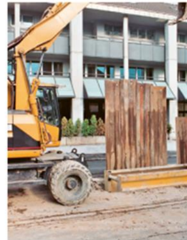
8 Sicherer Einbau von Spriessen.