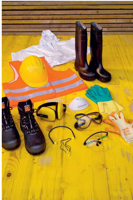
Bild: suva pro – Broschüre für Personen im temporären Einsatz; aus SUVA Publikation Nr. 88217.d